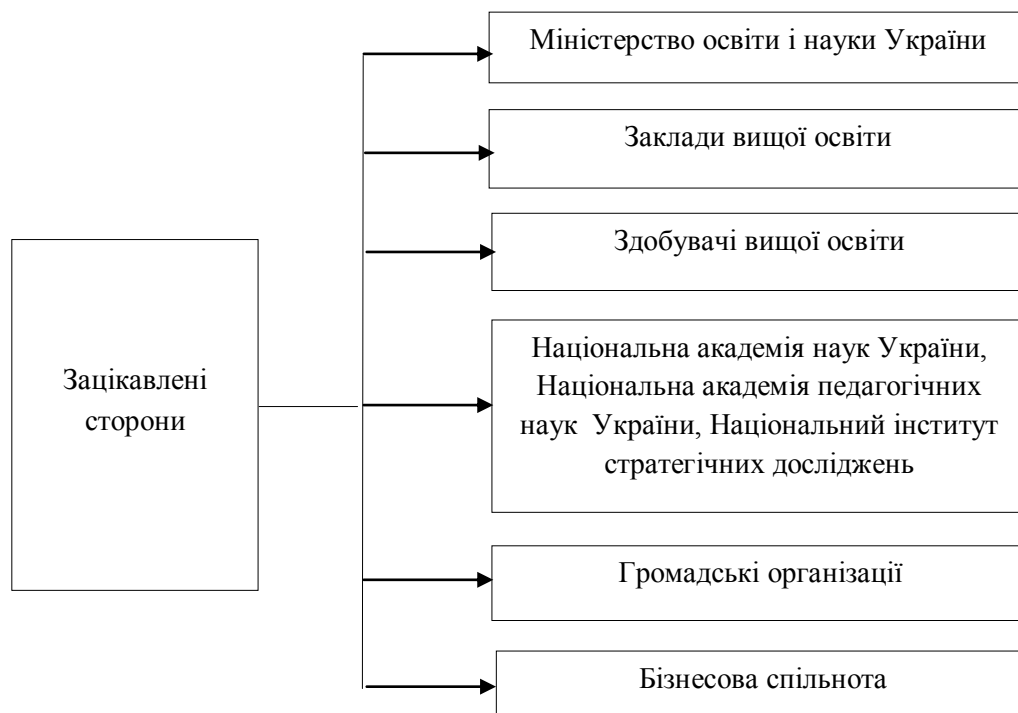
Рис. Б.1. Зацікавлені сторони в розробці та затвердженні проекту Стратегії розвитку вищої освіти в Україні на 2021–2031 роки.

На рис. Б.1 наведені зацікавлені сторони в розробці та затвердженні проекту Стратегії розвитку вищої освіти в Україні на 2021–2031 роки.