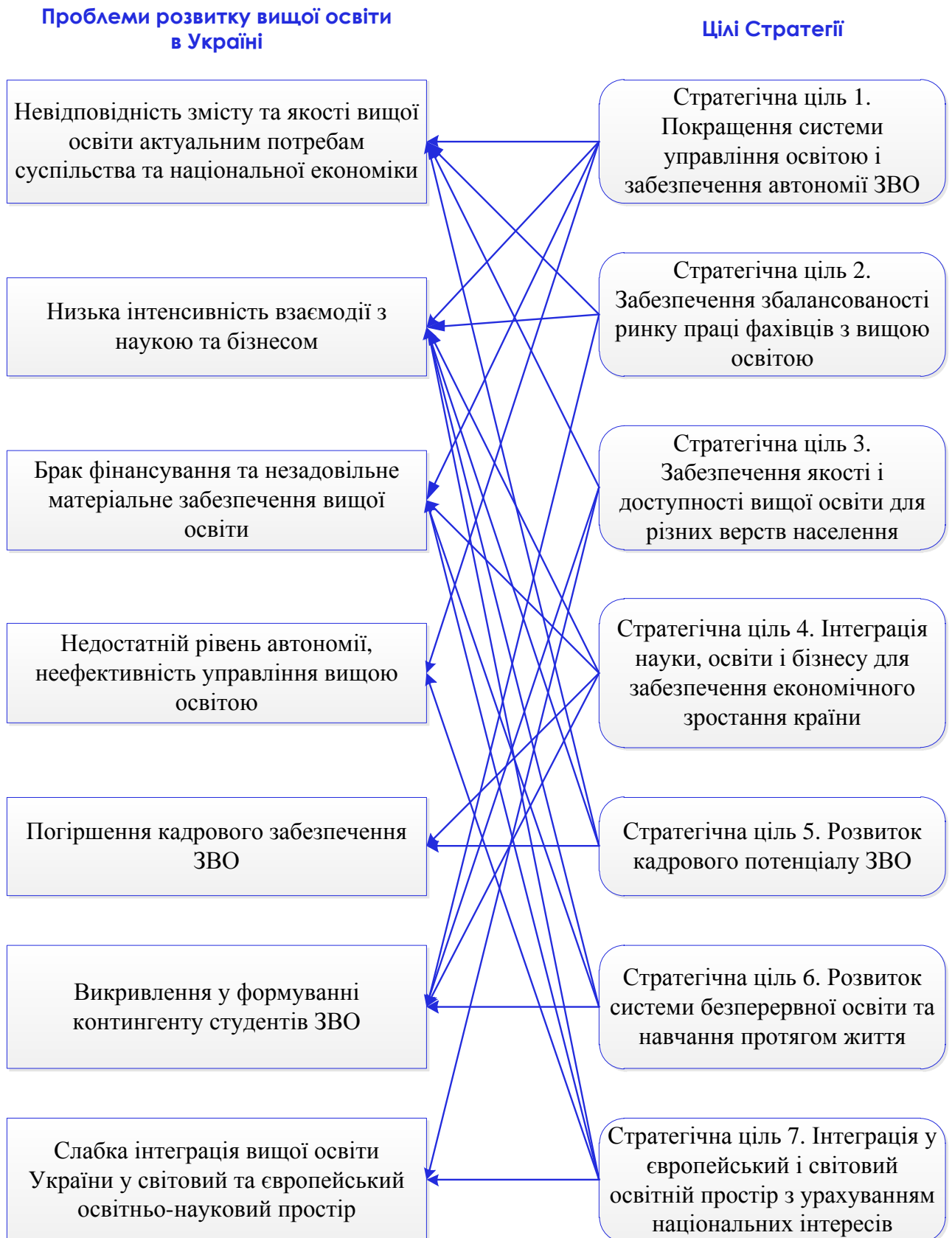
Схема взаємозв'язку стратегічних цілей та проблем розвитку вищої освіти в Україні